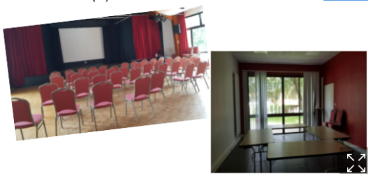
Les salles (1)