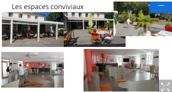
Les espaces conviviaux