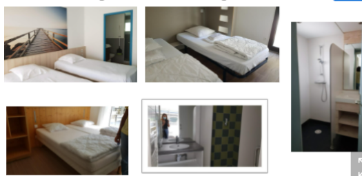
Le couchage : chambres et gîtes